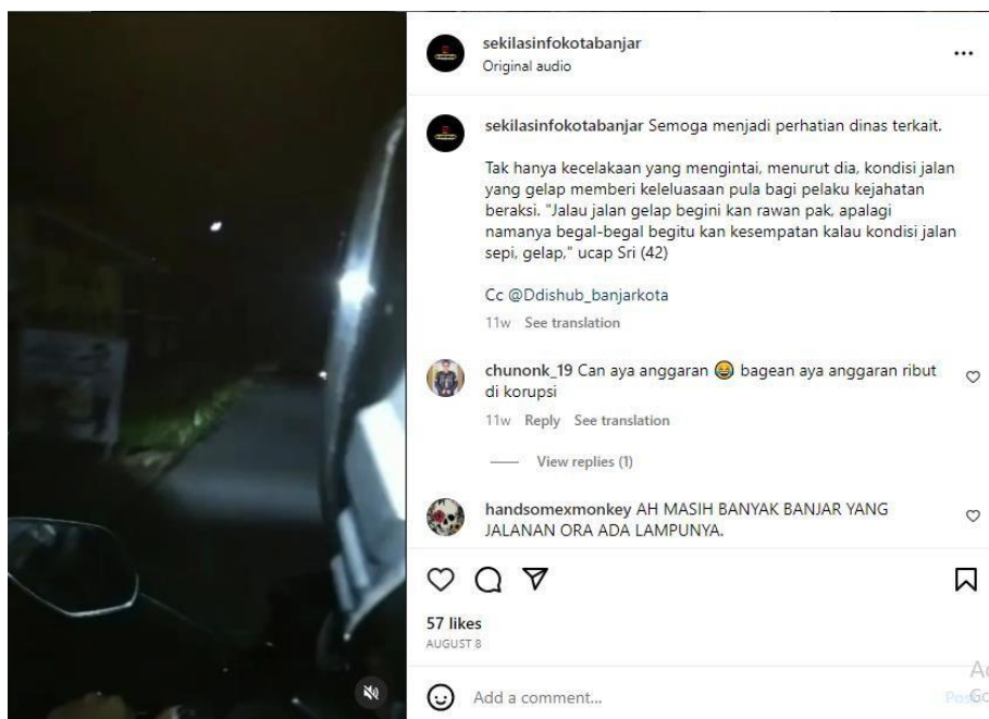
Gambar 1 Contoh Citizen Journalism Di Media Sosial

Citizen Journalism merupakan suatu kegiatan jurnalistik yang mana dilakukan oleh non-professional dan tidak berkaitan dengan organisasi media yang ditulis dengan berdasar pada sudut pandang warga atau anggota masyarakat. Dalam reformasi saat ini, citizen journalism merupakan era yang baru di temui, citizen journalism merupakan perkembangan jurnalisme baru dalam era modern. Fase tersebut ditandai dengan keterlibatan warga yang tidak hanya menerima informasi melainkan menyampaikan juga menyebarkan informasi salah satunya dalam media sosial. Meskipun dalam menjadi citizen journalism ini tidak ada pelatihan khusus mengenai jurnalisme namun warga sangat berminat pada citizen journalism dengan memanfaatkan internet menjadi salah satu penyebaran informasi sekitar. Media sosial dapat digunakan juga untuk mengkomunikasikan berbagai informasi yang diminati dan penyampaianya dapat berupa teks, foto ataupun video.