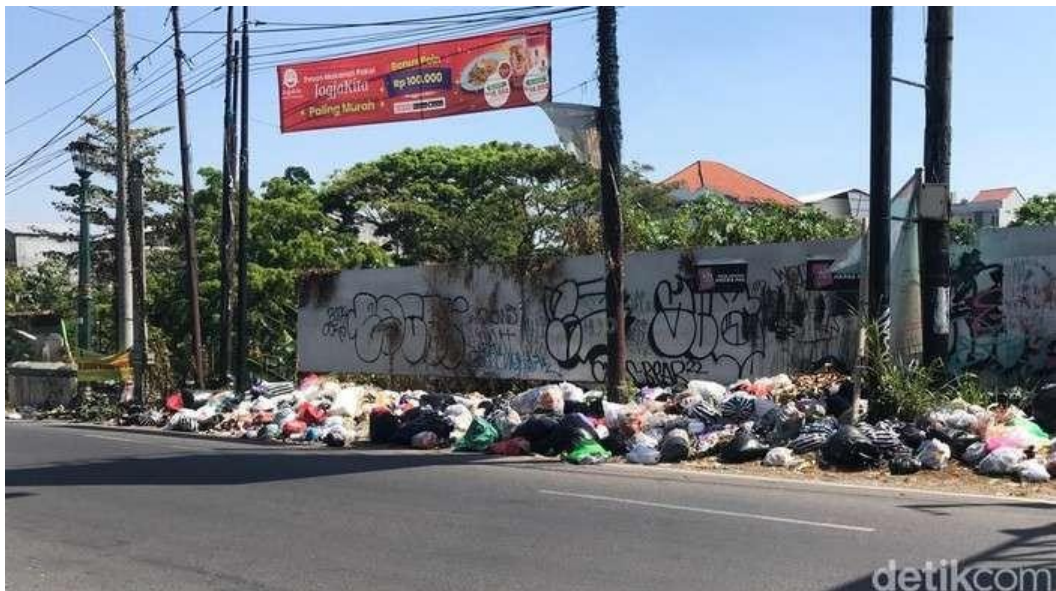
Gambar 1.1 Tumpukan sampah di pinggir jalan kota Yogyakarta

Penutupan TPST Piyungan berdampak pada pembuangan dan Tumpukan sampah sembarangan oleh masyarakat. Pembuangan dan Tumpukan sampah dapat ditemui di sepanjang pinggir jalan kota Yogyakarta yang menyebabkan masalah lingkungan dan kesehatan masyarakat.