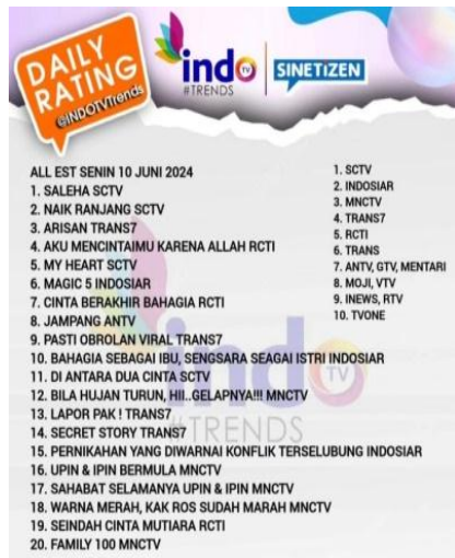
Gambar 3. Top Rating Program TV pada Juni 2024

wawancara yang dilakukan di dalam sebuah kantor polisi.