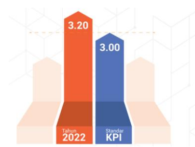
Gambar 1. Hasil Indeks Kualitas Program Siaran Televisi Tahun 2022

bersama bahwa terjadi peningkatan kualitas konten dari program-program siaran di Tanah Air.