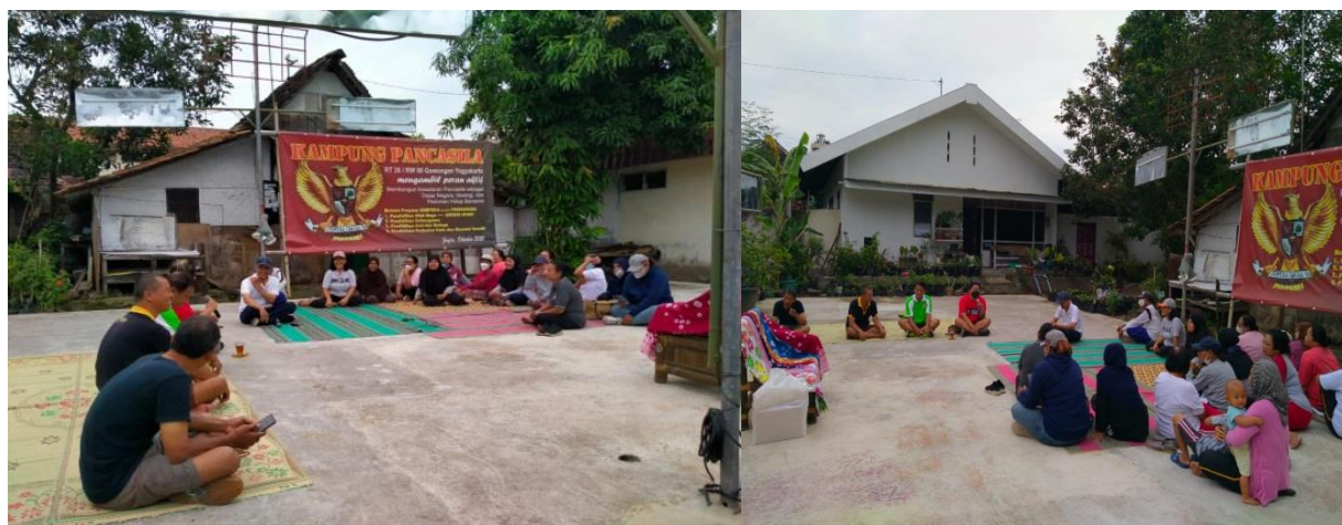
Gambar 2. Kegiatan Masyarakat Melakukan Diskusi di Lapangan

Berdasarkan hasil survei terhadap 65 responden di atas menunjukkan bahwa suatu masyarakat dapat melaksanakan program pembangunan yang berkelanjutan ketika semangat untuk mengikuti kegiatan sosial di masyarakat sangat tinggi. Hal ini ditunjukkan di kampung Pancasila, Gowongan Kidul RT 26 memiliki dorongan untuk melakukan kegiatan sosial yang sangat tinggi.