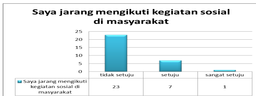
Gambar 1. Grafik Pertanyaan Kepada Responden

Berdasarkan hasil survei terhadap 65 responden di atas menunjukkan bahwa suatu masyarakat dapat melaksanakan program pembangunan yang berkelanjutan ketika semangat untuk mengikuti kegiatan sosial di masyarakat sangat tinggi. Hal ini ditunjukkan di kampung Pancasila, Gowongan Kidul RT 26 memiliki dorongan untuk melakukan kegiatan sosial yang sangat tinggi.