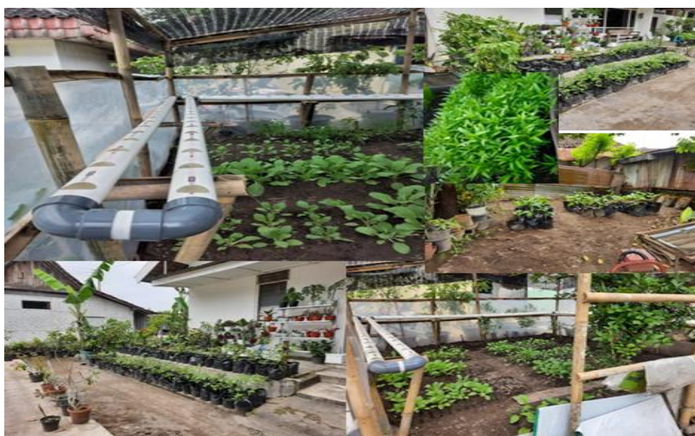
Gambar 4. Pertanian Kota Model Hidroponik

pertanian kota ini sejalan dengan konsep pendidikan untuk pembangunan yang berkelanjutan ( education for sustainable development ). Pertanian kota mulai digagas dan dibuat pada bulan Oktober-November 2021. Kegiatan untuk mengembangkan edukasi lingkungan dan kesadaran untuk memanfaatkan lahan “tidur” dengan menanam berbagai tanaman sayuran seperti sawi, kangkung, terong, cabai, dan jeruk nipis. Pada panen pertama telah menghasilkan 13,5 kg kangkung dan 3,5 kg sawi (Hasil wawancara dengan Bapak Sapto Nugroho, 20 Februari 2022, 21:32).