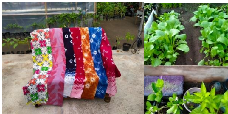
Gambar 5: Hasil Produk Kampung Pancasila