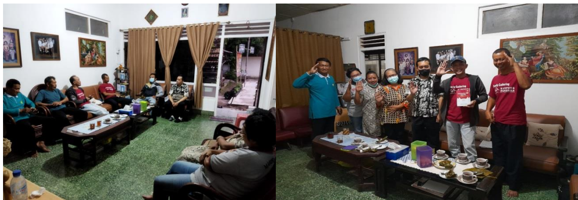
Gambar 3. Diskusi Bersama Antara Pengurus kampung, Akademisi dan Tokoh Masyarakat Lain

Pancasila dengan mengundang tokoh masyarakat lain, pemangku kebijakan seperti kecamatan, anggota dewan kota dan provinsi, akademisi, serta perusahaan untuk bisa memberikan kontribusi dalam pembangunan dan pengembangan masyarakat di kampung Pancasila, gowongan kidul.