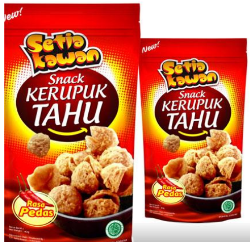
Gambar 1. 3 Referensi Desain Kemasan Primer Kompetitor Lain. 5