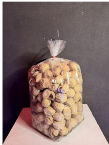
Gambar 1. 1 Kemasan Kripik Tahu Pong Bima Karya Kemasan 1/2 Kg

Potensi dari produk Kripik tahu pong Bima Karya ini sangatlah besar untuk masuk ke pasar yang lebih luas, UMKM Bima Karya bisa memasuki pasar seperti supermarket, pusat oleh-oleh hingga pasar ekspor. Untuk mencapai pemasaran yang lebih baik dan luas perlu adanya proses konsep kreatif dan komunikatif untuk branding merk dari UMKM Bima Karya agar tercipta perkembangan dari UMKM Bima Karya.