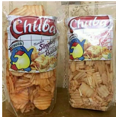
Gambar 1.5 Referensi Desain Kemasan Kripik 1/4kg Kompetitor Lain. 7

Melihat hal-hal tersebut pengembangan visual branding dirasa dapat menjadi media pilihan dalam perancangan ini. Branding yang biasa di kenal dengan merk , dan media pemasaran akan ditingkatkan agar terciptanya Branding yang lebih informatif dan menarik sehingga meningkatnya