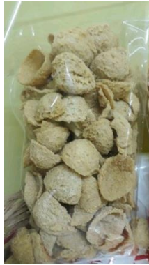
Gambar 1. 2 Referensi Kripik Tahu Pong Kemasan 1/4Kg. 4