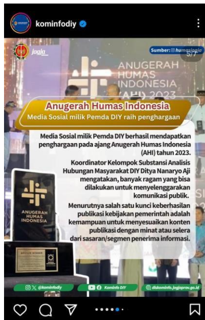
gambar 1 3 penghargaan @kominfodiy

Sehubungan dengan pesatnya arus komunikasi dan informasi kepada Masyarakat kota Yogyakarta, kami berharap melalui penelitian dapat dipelajari bagaimana memanfaatkan media sosial Instagram sebagai media publikasi dan informasi pada Dinas Komunikasi dan Informasi Daerah Istimewa Yogyakarta. Berdasarkan latar belakang yang dikemukakan oleh penulis di atas, yang tertarik untuk melakukan penelitian dengan menggunakan judul “PEMANFAATAN INSTAGRAM SEBAGAI MEDIA PUBLIKASI DAN INFORMASI DINAS KOMUNIKASI DAN INFORMATIKA DAERAH ISTIMEWA YOGYAKARTA”.