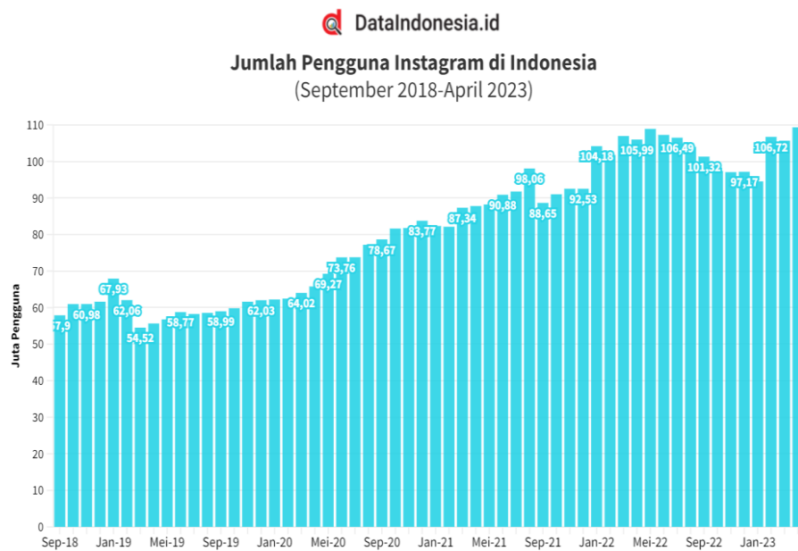
gambar 1 1 Data Jumlah pengguna Instagram di Indonesia

dan kesadaran terkait berbagai isu, seperti pendidikan kesehatan, lingkungan, keamanan, atau hal-hal lain yang relevan bagi Masyarakat serta berkomunikasi dan memberikan informasi yang akurat dan terpercaya sehingga pesan mereka diterima oleh masyarakat dan mengukur dampak dari informasi yang mereka sebar.