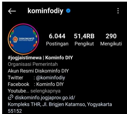
gambar 1 2 Akun Instagram @kominfodiy

Penulis memilih Dinas Komunikasi dan Informatika Daerah Istimewa Yogyakarta sebagai objek penelitian karena Dinas Komunikasi dan Informatika Daerah Istimewa Yogyakarta merupakan instansi pemerintahan yang memiliki tanggung jawab untuk melaksanakan tugas yang berhubungan dengan media publikasi dan informasi, Dinas Komunikasi dan Informatika Daerah Istimewa Yogyakarta membantu Masyarakat khususnya Masyarakat kota Yogyakarta untuk memberi informasi yang benar serta edukasi dan sosialisasi terhadap pelanggaran etika pada sosial media. Diskominfo DIY sendiri memiliki prestasi atas keaktifan mereka menggunakan sosial media yaitu dalam ajang Anugerah Media Humas yang mendapatkan penghargaan dalam kategori media sosial terbaik dan media audiovisual terbaik. Kegiatan hmas digital pada sosial media Dinas Komunikasi dan Informatika Daerah Istimewa Yogyakarta dapat membantu serta meningkatkan kualitas pelayanan public bagi Masyarakat kota Yogyakarta melalu publikasi dalam akun Instagram @koinfoDIY. Dalam pemanfaatan media ini dapat mempermudah Masyarakat kota Yogyakarta untuk mendapatkan informasi seputar kota Yogyakarta.