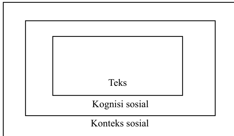
Gambar 1.2 Dimensi Model Analisis

Gambar diatas merupakan gambaran dari dimensi model analisis. Analisis teks terdiri dari struktur makro, superstruktur dan struktur mikro. Sedangkan kognisi sosial Van Dijk memiliki pandangan bahwa analisis wacana tidak dapat dibatasi oleh struktur teks. Oleh karenanya pemikiran penulis sangat diperlukan untuk memberikan makna lebih dalam. Pendapat dan ideologi pribadi penulis. Kemudian dimensi konteks sosial merupakan bagaimana cara melihat sebuah wacana diproduksi dan di konstruksikan oleh masyarakat. Dalam memahami sebuah wacana tidak cukup dengan menganalisis teks dan memahami melalui pandangan diri sendiri, sehingga dibutuhkan timbal balik dari masyarakat.