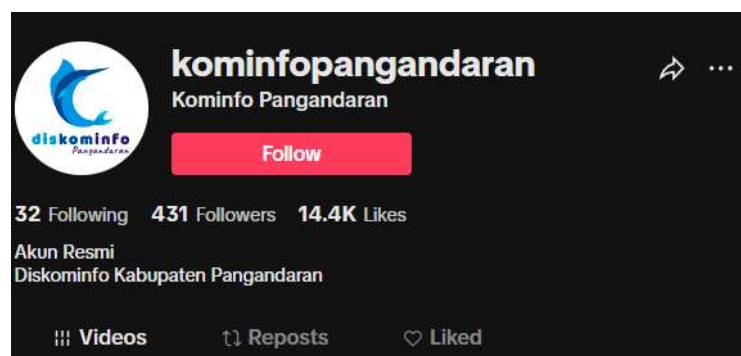
Gambar 1.2 Akun TikTok @kominfopangandaran

Di era digital ini, beredar banyak informasi yang tidak akurat dan menyesatkan. Oleh karena itu, Diskominfo Kabupaten Pangandaran memiliki peran penting dalam membantu masyarakat untuk mendapatkan informasi yang benar dan terpercaya. Hal ini dilakukan melalui penyebaran informasi resmi, klarifikasi terhadap informasi yang tidak akurat, serta edukasi kepada masyarakat tentang literasi digital. Penggunaan media sosial yang semakin marak juga membawa tantangan baru, seperti pelanggaran etika bermedia sosial. Diskominfo Kabupaten Pangandaran memiliki peran penting dalam melakukan edukasi dan sosialisasi kepada masyarakat tentang etika bermedia sosial dengan tujuan menciptakan ruang digital yang kondusif, aman, dan nyaman bagi semua pengguna.