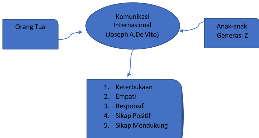
Bagan 1.1 Kerangka Konsep Penelitian