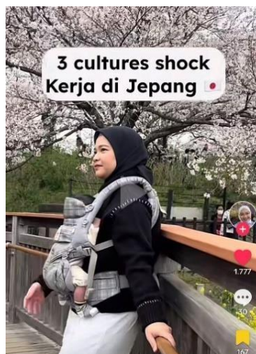
Gambar 1. 2 Pekerja Migran

berdiri di sisi kanan eskalator, sementara kendaraan justru berjalan disisi kiri jalan. Ketiga, ia menghadapi tantangan dalam hal pelayanan yang sangat cepat dan hambatan bahasa, khususnya ketika berada di restoran. Dalam situasi yang ia alami, pelayan sudah menanyakan pesanan kurang dari satu menit setelah menu diberikan, sementara ia masih berupaya memahami isi menu dengan bantuan aplikasi penerjemah karena keterbatasan dalam memahami bahasa lokal. 4