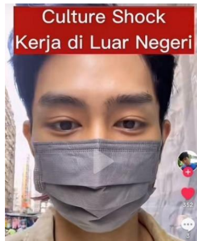
Gambar 1. 1 Pekerja Migran

Dalam konteks mobilitas kerja antarnegara, culture shock menjadi tantangan utama bagi pekerja migran atau pekerja asal Indonesia yang bekerja di luar negeri. Kondisi ini dapat terjadi dikarenakan para pekerja migran Indonesia harus menyesuaikan diri dengan lingkungan kerja di negara yang mungkin memiliki kebiasaan atau budaya yang berbeda dengan budaya di Indonesia. Perbedaan inilah yang kemudian dapat menimbulkan stres, ketidaknyamanan, dan bahkan konflik interpersonal jika tidak dikelola dengan baik.