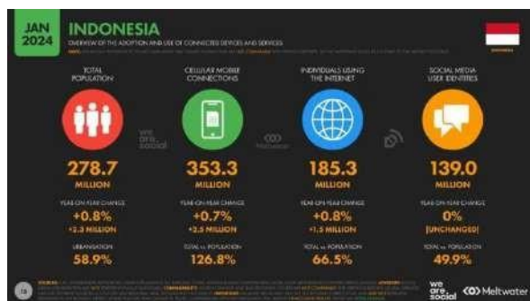
Gambar 1. 1 Gambar Data We Are Social