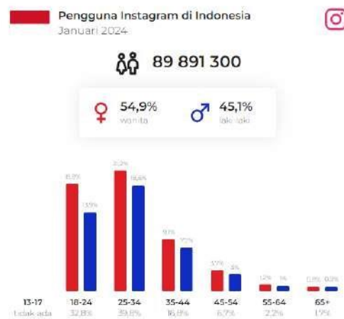
Gambar 1. 2 Data Pengguna Instagram Di Indonesia

Pertumbuhan pesat media sosial ini menciptakan ruang interaksi tanpa batas geografis dan waktu, memungkinkan pengguna berbagi pengalaman, pendapat, dan konten multimedia dengan mudah dan cepat. Selain memperluas jaringan sosial, media sosial juga memiliki pengaruh besar dalam membentuk budaya dan opini publik di era digital.