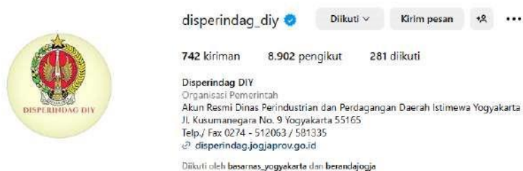
Gambar 1. 4Media sosial Instagram Disperindag DIY

Dalam konteks inilah, pemanfaatan media sosial menjadi salah satu strategi penting bagi Disperindag DIY untuk menjembatani kebutuhan informasi publik secara cepat, luas, dan tepat sasaran. Salah satu platform yang digunakan adalah Instagram, yang secara visual dapat menampilkan informasi terkini dengan cara yang lebih menarik dan mudah diakses oleh masyarakat.