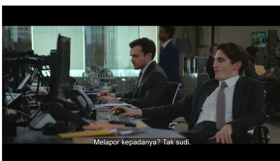
Gambar 3. Diagnose Causes Fair Play

Akar masalah Luke berlapis: lingkungan kerja yang sarat solidaritas maskulin dan budaya patriarki, serta narasi ideologis yang mengaitkan maskulinitas dengan dominasi. Kombinasi keduanya membentuk persepsi bahwa keberhasilan perempuan adalah ancaman, memperkuat ketidakmampuannya menerima perubahan peran gender.