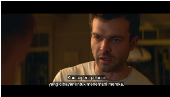
Gambar 2. Define Problems Fair Play

Film ini memposisikan masalah utama pada krisis maskulinitas Luke ketika keberhasilan Emily mengguncang keseimbangan kekuasaan dalam hubungan mereka. Alih-alih mampu mendefinisikan ulang peran maskulinnya, Luke menanggapi dengan penarikan diri, perilaku pasif-agresif, dan akhirnya kekerasan simbolik maupun seksual. Masalah ini merepresentasikan kegagalan individu untuk beradaptasi dengan pergeseran hierarki gender.