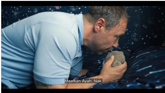
Gambar 10. Treatment Recommendation Adolescence

Miniseri ini menyerukan perlunya intervensi sistemik: pendidikan kritis tentang gender, literasi emosional bagi remaja laki-laki, pendampingan kesehatan mental, dan pengawasan terhadap penyebaran ideologi kebencian daring. Melalui simbolisme kamar Jamie yang kosong di akhir cerita, Adolescence memperingatkan bahwa tanpa tindakan kolektif, krisis maskulinitas remaja akan terus memicu tragedi serupa.