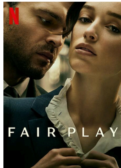
Gambar 1. Cover Film Fair Play