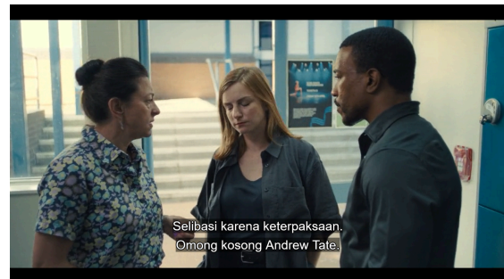
Gambar 8. Diagnose Causes Adolescence

Akar krisis maskulinitas Jamie berasal dari ekosistem yang kompleks: sekolah yang permisif terhadap perundungan berbasis gender, pergaulan sebaya yang mereproduksi norma maskulin hegemonik, keluarga yang absen secara emosional, dan ruang digital yang membanjiri remaja dengan ideologi misoginis. Faktor-faktor ini membentuk jejaring penyebab yang saling menguatkan, membuat Jamie rentan menginternalisasi pola pikir yang destruktif.