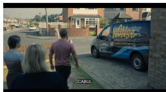
Gambar 9. Make Moral Judgement Adolescence

Serial ini menyajikan kritik tajam terhadap sistem yang membiarkan toxic masculinity bertumbuh tanpa pendidikan emosional. Jamie