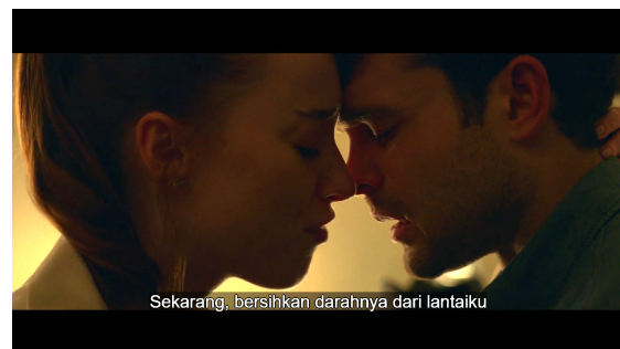
Gambar 5. Treatment Recommendation Fair Play

Akhir cerita menyajikan pesan peringatan: mempertahankan maskulinitas hegemonik hanya akan menghasilkan kehancuran personal dan relasional. Emily terpaksa merebut kembali kendali atas dirinya melalui cara ekstrem, merefleksikan bahwa selama norma gender tradisional tidak direvisi, kesetaraan dan keamanan emosional sulit tercapai.