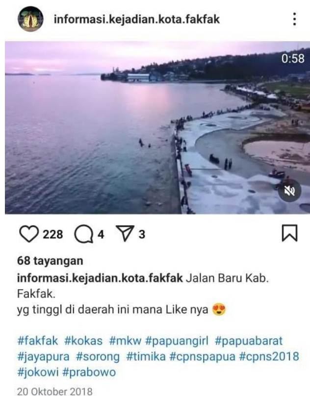
Gambar 2. Unggahan pertama akun instagram @info.kejadian.kota.fakfak (INKAFF)

Sebagai kota kecil, Fakfak memiliki karakteristik masyarakat yang cenderung mengandalkan komunikasi interpersonal dan media sosial untuk memperoleh berita terkini, sehingga akun instagram ini memegang peranan penting dalam memenuhi kebutuhan informasi publik.