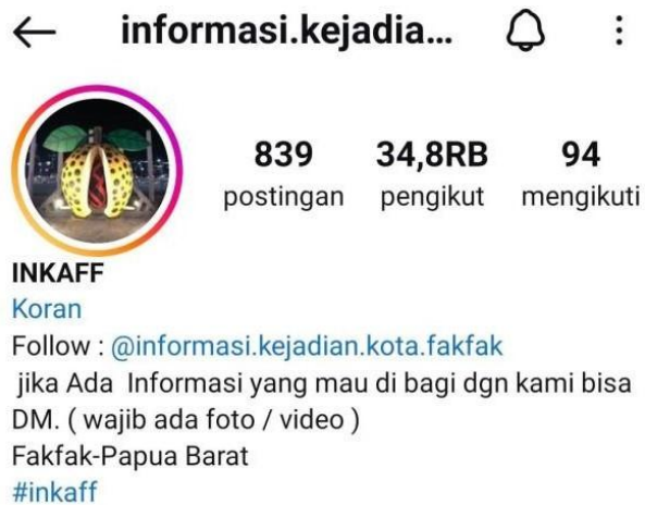
Gambar 1. Akun Instagram @info.kejadian.kota.fakfak (INKAFF)