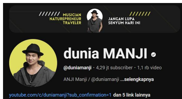
Gambar 1.2 Akun YouTube @dunia MANJI

yang menampilkan pertandingan basket dengan sentuhan hiburan dan wawancara bersama tokoh-tokoh terkenal. Meskipun channel YouTube Denny Sumargo dikenal dengan gaya santai dan humoris, beberapa kontennya menunjukkan kecenderungan misoginis, khususnya dalam format podcast “Curhat Bang” yang menghadirkan narasumber perempuan. Dalam beberapa episode, perempuan lebih sering dibahas dari segi penampilan fisik, kehidupan asmara, atau citra sensual dibandingkan pencapaian profesional mereka, yang menunjukkan adanya objektifikasi dan penguatan stereotip gender. Candaan berbau seksis dan framing visual yang menyorot tubuh perempuan juga memperkuat praktik male gaze , di mana perempuan diposisikan sebagai objek hiburan laki-laki. Meskipun dibungkus dalam format hiburan, narasi-narasi semacam ini secara tidak langsung melanggengkan budaya patriarki dan menormalisasi pandangan yang merendahkan peran dan nilai perempuan di ruang publik. 9