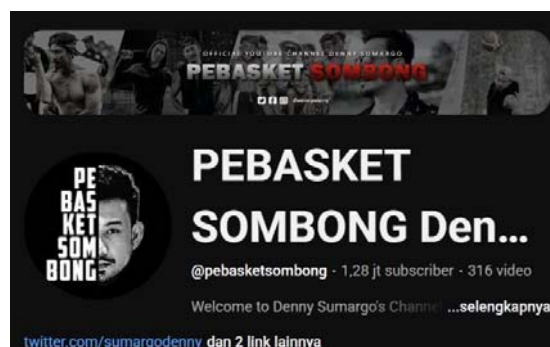
Gambar 1. 1 Akun YouTube @PEBASKET SOMBONG

Salah satu contohnya dapat ditemukan dalam sejumlah kanal YouTube yang menayangkan pertandingan biliar dengan sorotan kamera yang berlebihan pada tubuh atlet perempuan, khususnya bagian dada atau pinggul. Judul video pun kerap dibuat dengan gaya clickbait yang menggiring penonton untuk mengonsumsi konten bukan karena kualitas pertandingan, melainkan karena daya tarik seksual visual yang ditampilkan.